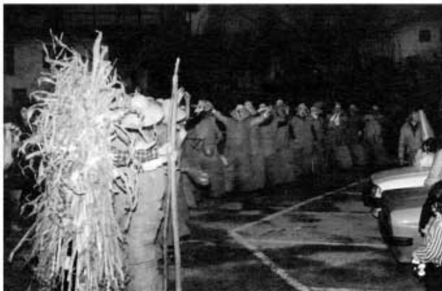
Carnaval de Lesaka (N)