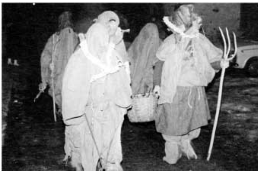
Carnaval de Lantz (N)