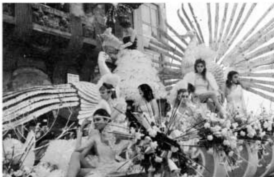
Carnaval de Donostia-Se gasta en la elaboración de lujosas carrozas