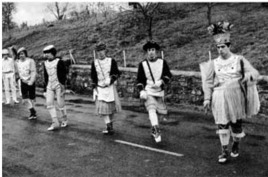
Pastoral de Eskinla (Z)