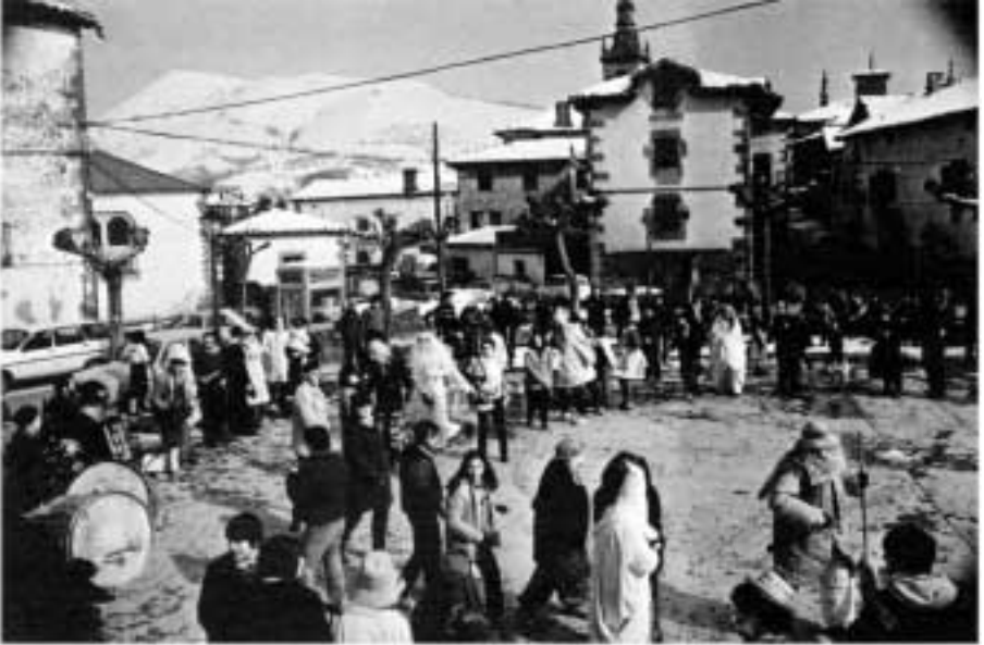
Carnaval de Arizkun- Participación colectiva en el baile.