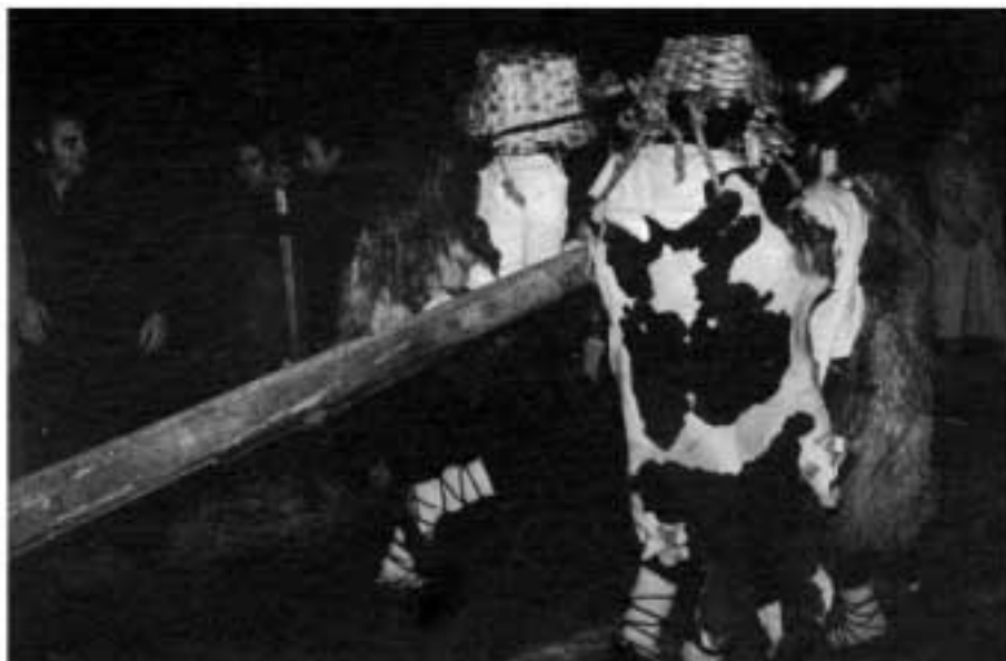
Carnaval de Altsasu (N)