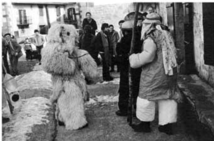
Carnaval de Arizkun (N)