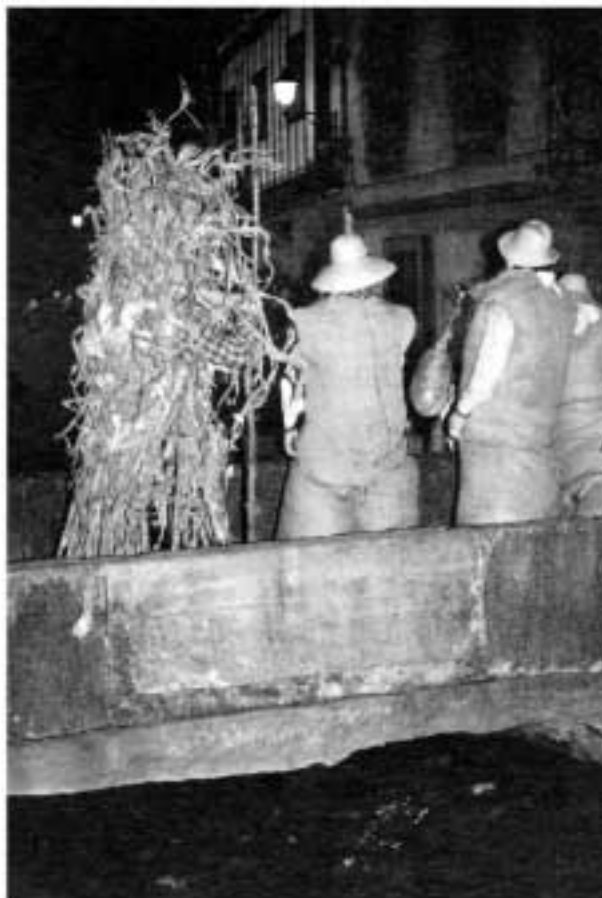
Carnaval de LESAKA Los disfraces son confeccionados por elementos cercanos y gratuitos. Así tallos, pajas, o sacos. Se respeta la tradición.