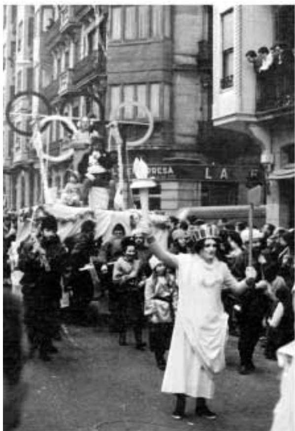
Carnaval de Donosti (G)