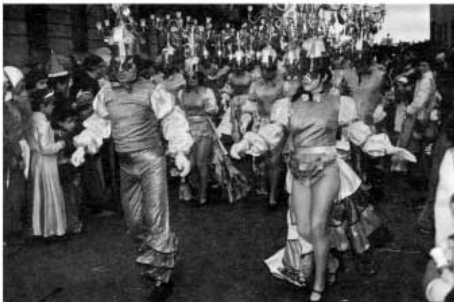
Carnaval de Donostia - La imaginación, originalidad es mayor que en el carnaval rural